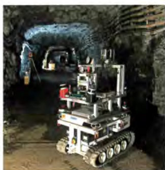
Cover page: Towards autonomous underground machines: Dora exploration vehicle (funded by the BMBF, FKZ 033R126D). Titelseite: Auf dem Weg zu autonomen Untertagemaschinen: Das Erkundungsfahrzeug Dora (gefördert vom BMBF, FKZ 033R126D).