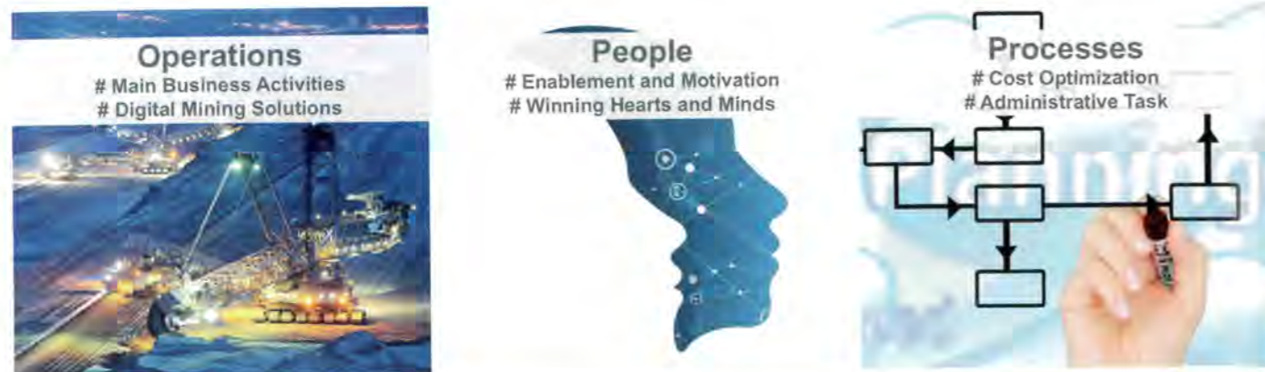
Fig. 1. Main pillars of DMT's Mining 4.0 portfolio. Bild 1. Themenschwerpunkte des Bergbau 4.0-Portfolios der DMT.

raw material extraction can only be achieved with an increased degree of automation and digitalization. The introduction of remote-controlled equipment and autonomous machines can significantly reduce the deployment of employees in mining operations and thus the risk to human life. Furthermore, mine operators are faced with the challenge of maintaining and, where possible, further increasing the quality and quantity of raw materials under increasingly complex geological conditions. In addition, infrastructures that already have been taken for granted over years in our everyday lives have yet to be built and implemented within mining. This includes among other things the provision of internet reception with corresponding security standards in underground mining operations. Sensor technology, which is already standard in cars, must also be adapted to the special requirements of mining and the associated disturbing influences of dust, mechanical stress, extreme temperatures, water or explosive gases (1).