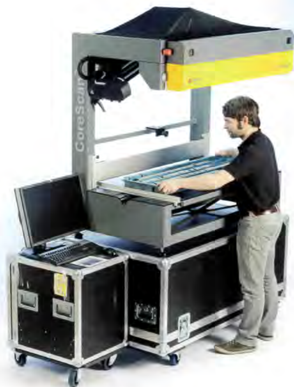
Fig. 3. // Bild 3. DMT CoreScan ® 3.

Such technologies furthermore enable remote data acquisition in regions of the world that are difficult to access or which contain a high security risk.