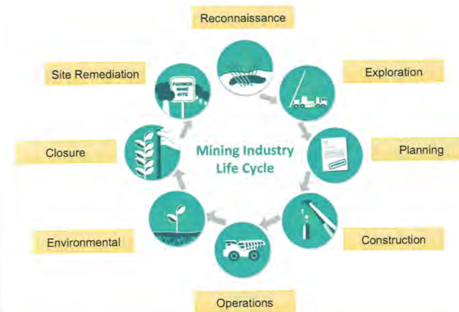
Fig. 2. Life cycle of the mining industry. // Bild 2. Lebenszyklus der Rohstoffindustrie.

Neben der Entwicklung derartiger maßgeschneiderter operativer Lösungen dürfen im Hinblick auf Bergbau 4.0 auch die