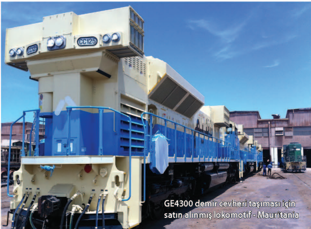
GE4300 demir cevheri taşımaya için satın alınmış lokomotif - Mauritania

Bu bölüm, "Borçlu" proje sahibinin mühendislerince ayrıntılarıyla ilgilenebileceğinden, KKBM'nin bu aşamadaki rolü genelde yine düşüktür ancak KKBM'nin bu etkinliklere katılması "Borçlu" proje sahibinin inisiyatifine kalmıştır. Bu durum özellikle saydamlığı sağlaması açısından KKBM'nin bu etkinliğe katılmasıyla doğrudandır.