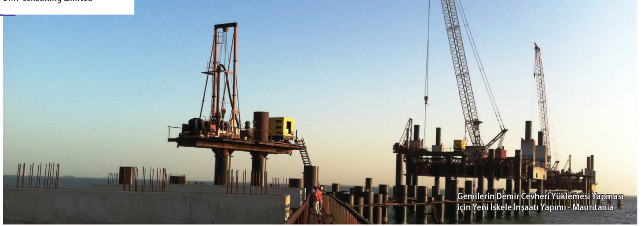
Gemilerin Demir Cevheri Yükleme Yapması İçin Yeni İskele İnşaatı Yapımı - Mauritania

K redi Kurumları Bağımsız Mühendisleri [KKBM]'nin (Independent Lenders Engineer-ILE) maden projelerindeki rolü yine Jones & Arden tarafından, Madencilik Türkiye dergisinin 45. sayısında verilmişti. Şu andaki sunum, daha önceleri IMC olarak bilinen DMT'nin uzun yıllar danışmanlık verip olumlu katkılarda bulunduğu maden projelerinde çok önemli bir konu olan "Tedarik ve Hizmetler" ve "Sözleşmeler" ile ilgili edindiği deneyimleri içermektedir.